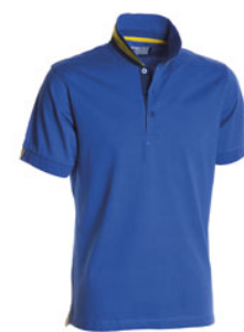
BLEU ROI/JAUNE-BLEU MARINE