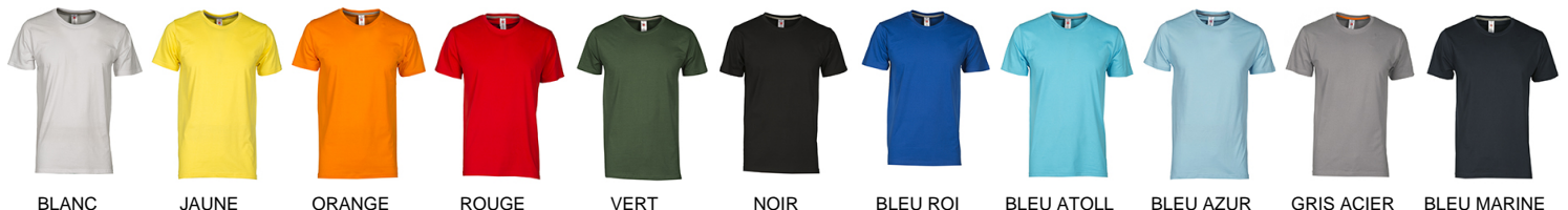
BLANC JAUNE ORANGE ROUGE VERT NOIR BLEU ROI BLEU ATOLL BLEU AZUR GRIS ACIER BLEU MARINE