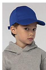
SOL'S SUNNY KIDS 88111